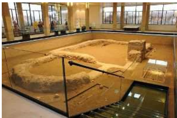
Pohled do expozice Památníku Velké Moravy