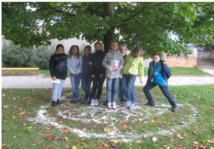
Land-art si v hodině výtvarné výchovy vyzkoušeli i žáci 6. C