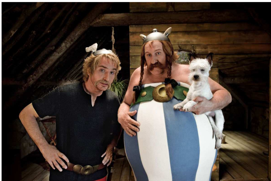
Asterix a Obelix připraveni k akci