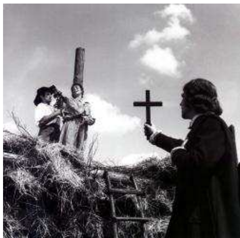
Záběr z filmu Kladivo na čarodějnice