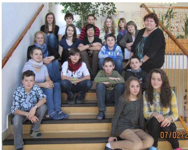
Ekotým v celé kráse