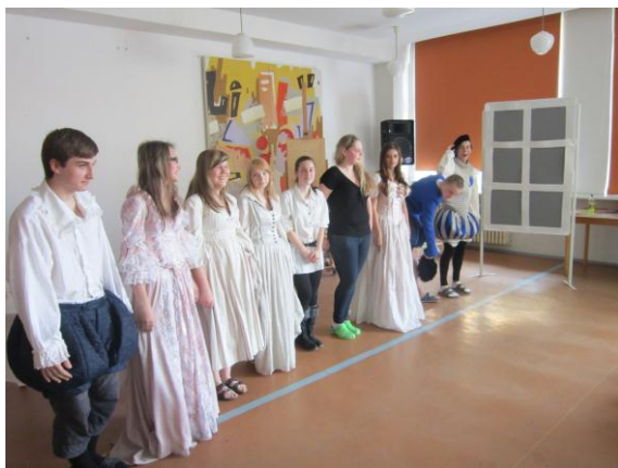
Herecké naděje z devátých ročníků