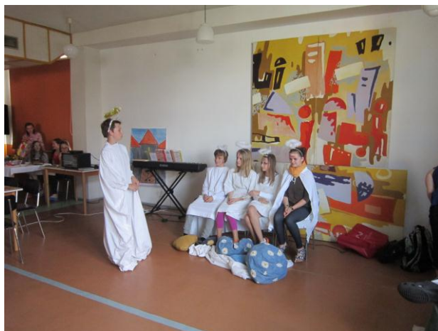
Skupinka světců spočívala na nebesích