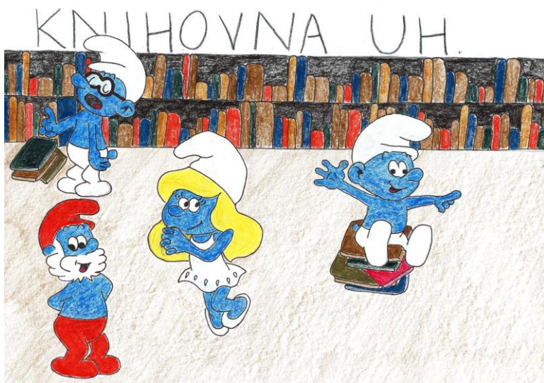
Karolína Wanke, 7. A