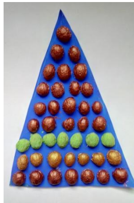
Sládečková Natálie, VI. B

Zbytky staré vlny se dají rovněž využít. Ačkoliv se jedná o výrobu dekorace, jež vyžaduje nejenom větší množství času, ale především trpělivost, konečná podoba ale určitě stojí za námahu.