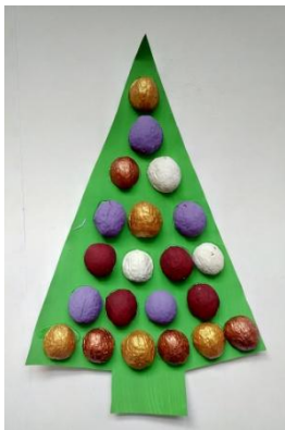
Skládalová Sára, VI. B

Ořechové skořápky stačí jen natřít různými barvami, nalepit na papír a vánoční strom na zeď může v době svátků ozdobit nejednu domácnost 😊.