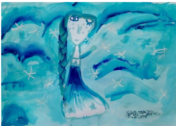
Svobodová Alžběta, VII. B