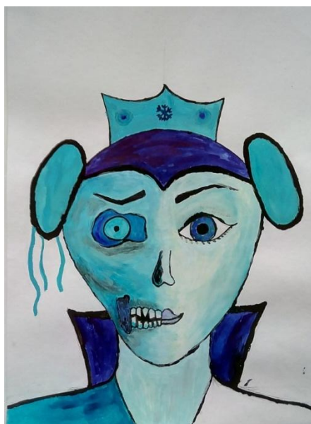
Lesová Barbora, VII. C