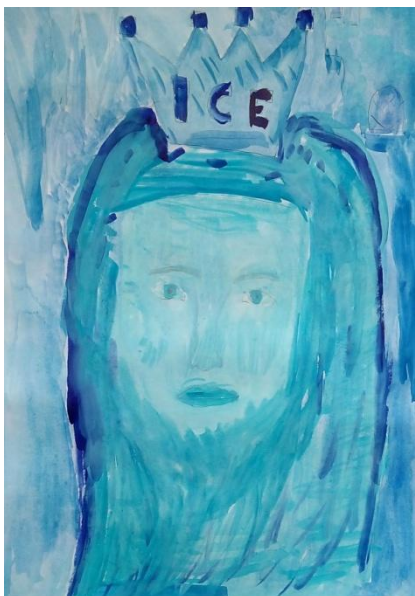
Bajaja Ondřej, VII. C