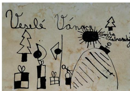
Záborský Vojtěch, VII. C