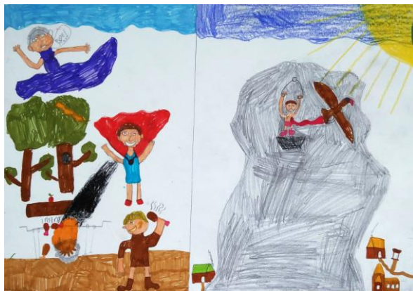
Prométheus - Friak Jakub, VI. A

Pojďme si alespoň část jejich prací ukázat!