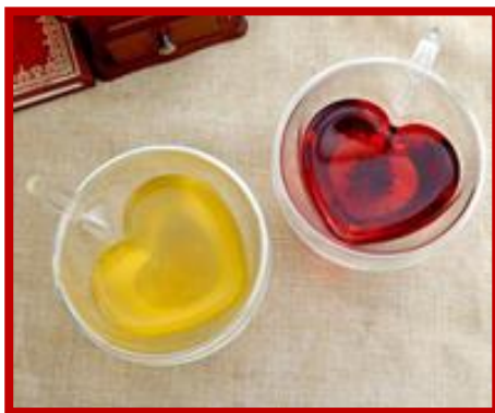
Stylové hrníčky ve tvaru srdce