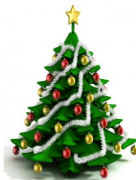
Drátkované ozdoby vytvořené žáky ve výtvarných činnostech