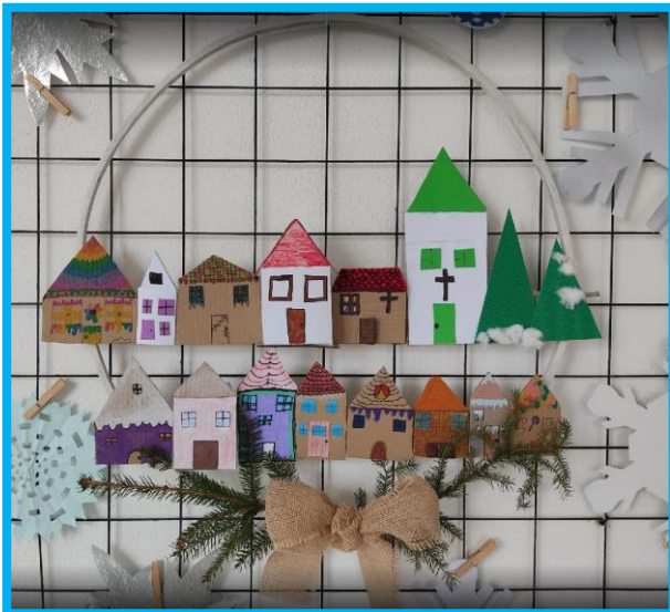
Zimní vesnička – žáci 7. B