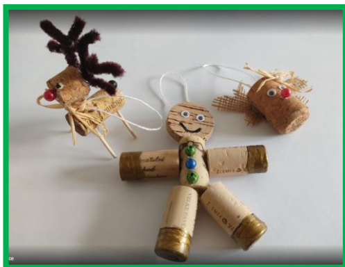
Korkové vánoční ozdoby – práce žáků 6. D

Obchody jsou plné vánočních dekorací, ale pojd'te se s námi podívat na malou ochutnávku toho, co vyrobily naše děti. 😊