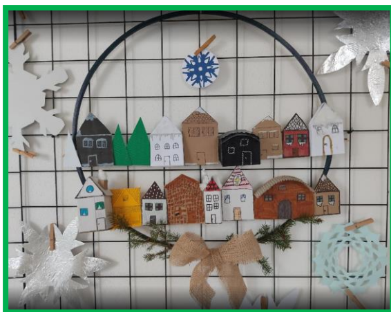
Zimní vesnička – žáci 7. D