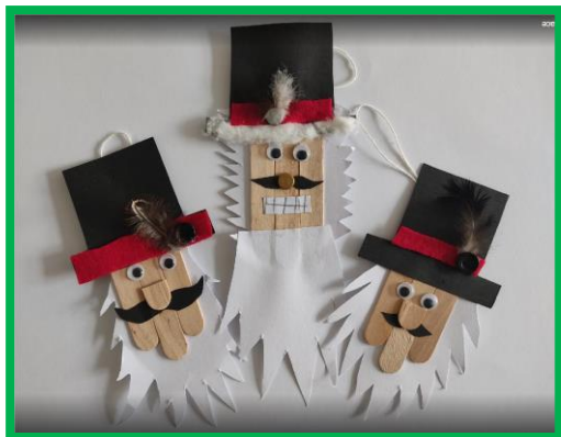
Vánoční ozdoby z dřevěných špejlí – práce žáků 6. E