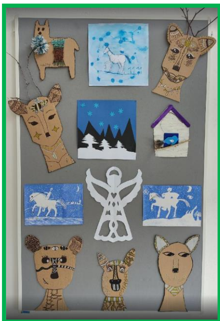
Práce žáků 6. D a 6. E