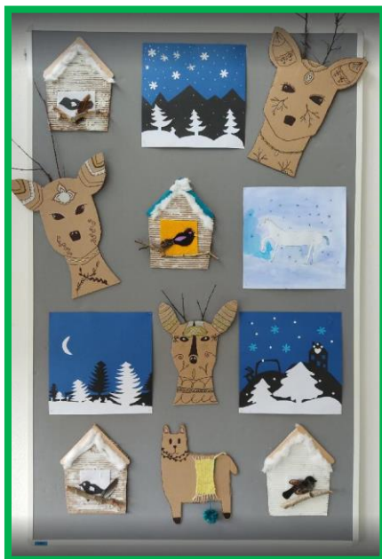
Práce žáků 6. D a 6. E